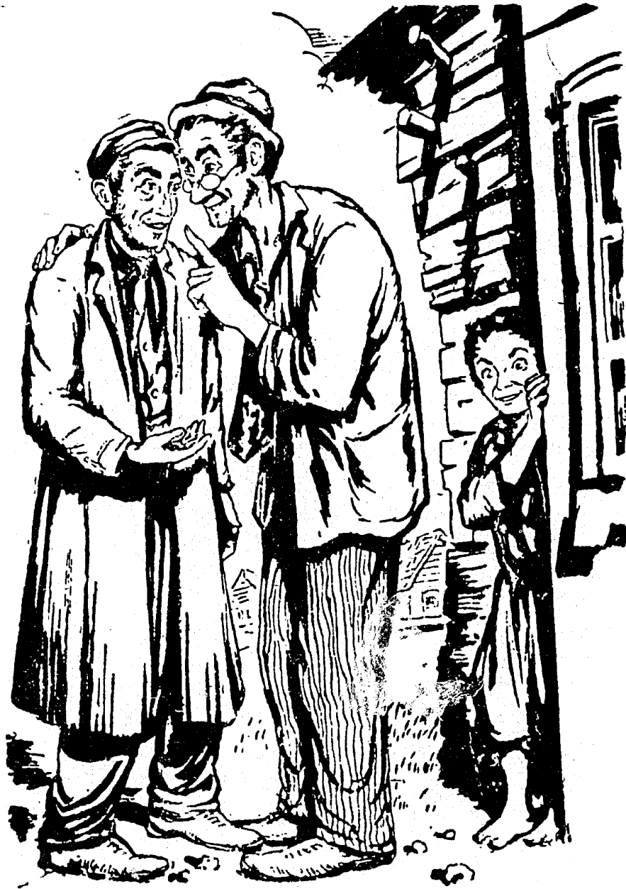
וויבאָרד א סוד — פון איד וויסן.